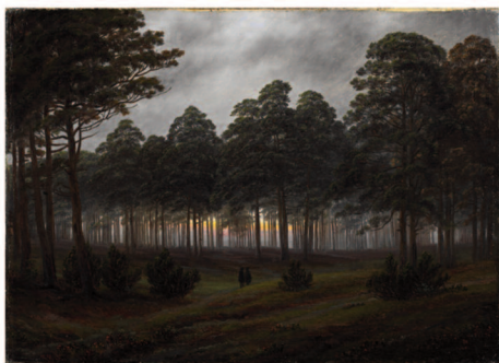
Caspar David Friedrich: Der Abend (1821)