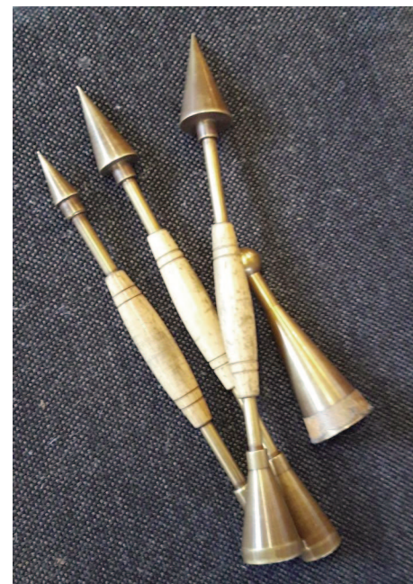
Bild 1 Orgelstimmer und Tastenhalter Bild 2 Stimmhörner für Lippenpfeifen

Der Orgelstimmer ruft die genaue Tonbezeichnung, der Tastenhalter drückt die Taste. Er drückt die Taste so lange, bis er ein „weiter“ hört. Die Labialpfeifen (Lippenpfeifen, Tonerzeugung durch brechenden Luftstrom) werden mit einem stabförmigen Spezialwerkzeug mit einem spitzen Kegel an dem einen und einem Trichter an dem anderen Ende (Stimmhorn), die Lingualpfeifen (Zungenpfeifen, Tonerzeugung durch schwingende Metallzunge) mit einem Flacheisen (Stimmmesser) gestimmt. Der ganze Vorgang hat rd. 5,5 Std. reine Arbeitszeit pro Person gedauert.