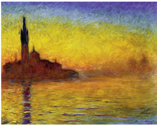
Claude Monet: Abendstimmung in Venedig (1908)