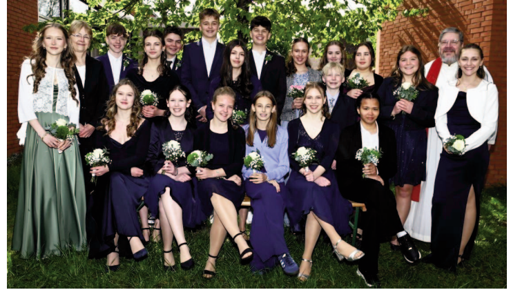
Konfirmation am 25.4.26 in der Matthiaskirche mit Dn. Jörs und P.i.R. Voget