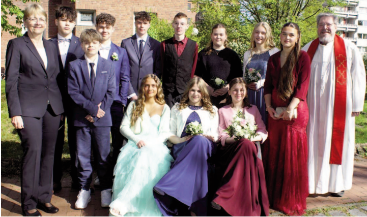
Konfirmation am 26.4.26 in der Dietrich-Bonhoeffer-Kirche mit Dn. Jörs und P.i.R. Voget

Wir gratulieren sehr herzlich und wünschen Gottes Segen auf allen kommenden Wegen!